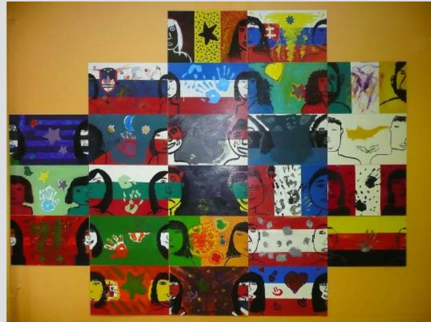
Grand tableau collectif : « La géographie du jour » réalisé par les élèves au cours de l'atelier avec Alain Simon