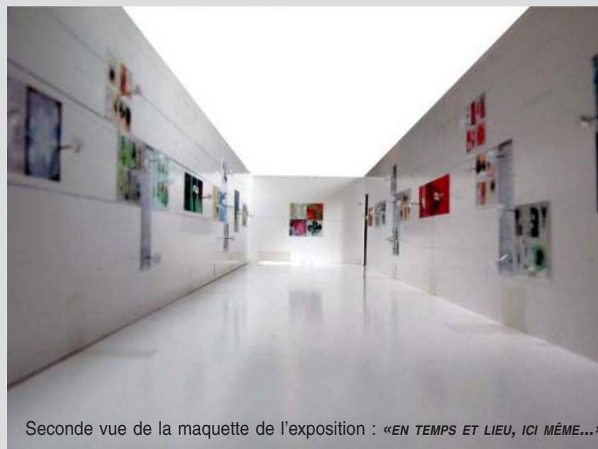
Seconde vue de la maquette de l'exposition : «EN TEMPS ET LIEU, ICI MÊME...»

Dans le cadre de l'animation de l'ERA : « Georges de la Tour » (espace réservé à l'art), la visite du plasticien Alain Simon au Collège de Rohrbach-les-Bitche s'est déroulée en deux temps. D'abord à partir du 27 mars, mise en place de l'exposition : « EN TEMPS ET EN LIEU, ICI MÊME... ». Ensuite autour de cet accrochage l'artiste a travaillé durant 2 séances de 8 heures avec un groupe de 25 élèves de Troi-