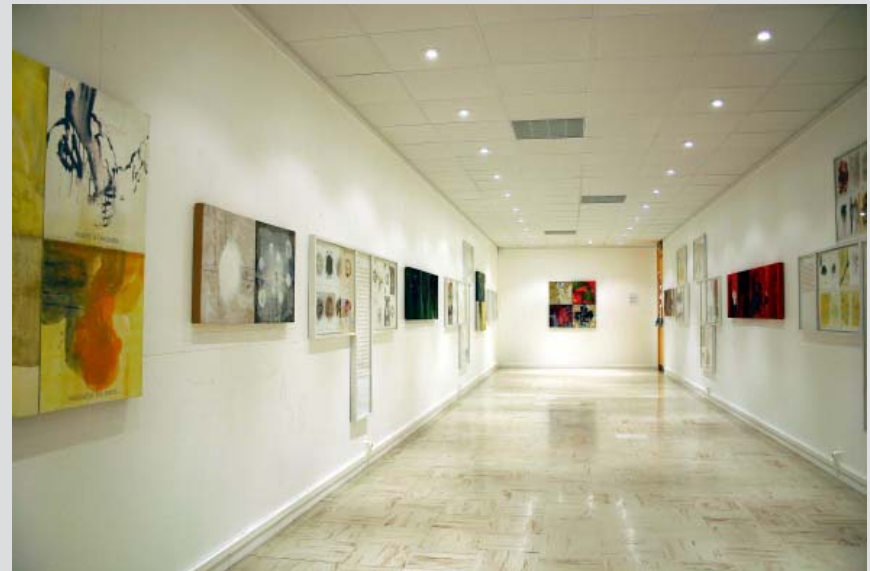
Différentes vues de l'exposition : « En temps et en lieu, ici même ... » d'Alain Simon