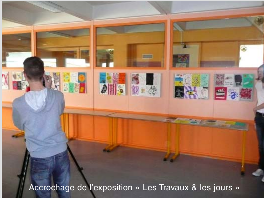
Accrochage de l'exposition « Les Travaux & les jours »