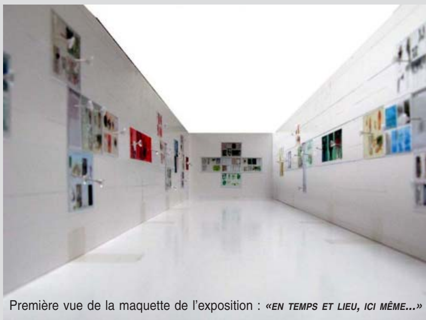
Première vue de la maquette de l'exposition : «EN TEMPS ET LIEU, ICI MÊME...»

Quelques rencontres à dessein, ludiques et sensibles, de mots, de dessins et de peintures